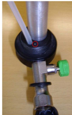
Überarbeitete Pumpe mit Markierung